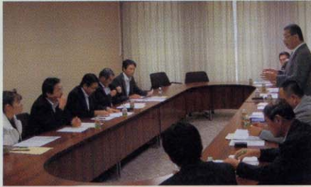
・京都府建設業協会との意見交換会 京都府内の建設業者の現状や入札制度改革について意見を交換しました。

自民党議員団は府民の声を府政に反映させるため、勉強会や各種団体との意見交換を行いました。