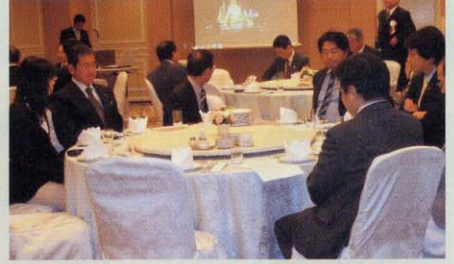
・日タイ親善京都府議会議員連盟総会 タイ王国大阪総領事館の副総領事とタイからの留学生を迎えて、これまでのタイと日本との関係や、今後の友好について意見を交換しました。