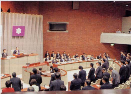
定数条例案を起立採決する

平成22年9月定例会 平成22年度9月補正予算を可決 平成22年9月22日に開会された9月定例会は、平成22年度9月補正予算案など計26議案を可決し、10月8日に閉会いたしました。 9月補正予算では、円高をはじめとした厳しい経済・雇用情勢、記録的な猛暑への緊急対策を行うとともに、高齢者をはじめ社会的に弱い立場にある方々を守る地域包括ケアの取組など、府民生活を守るきめ細かな対策に取り組むために、総額41億円の補正予算を可決しました。