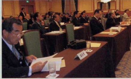
・京都府歯科医師会との意見交換会 歯科医療の現実・問題点、医療政策の是正と政治的課題について意見交換を行いました。