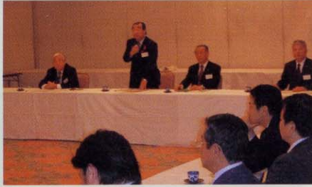
・森林・林業活性化京都府議会議員連盟総会 京都府森林組合連合会の役員を迎えて京都府の林業の現状や今後の課題、府内産木材の利用について意見を交換しました。