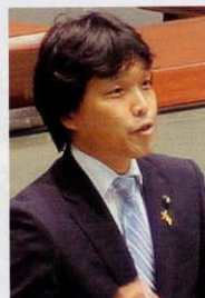
二ノ湯しんじ (右京区)

世界規模での転換期に、 我が国の底力を引き出す行政の在り方を 根本的議論すべきだ！