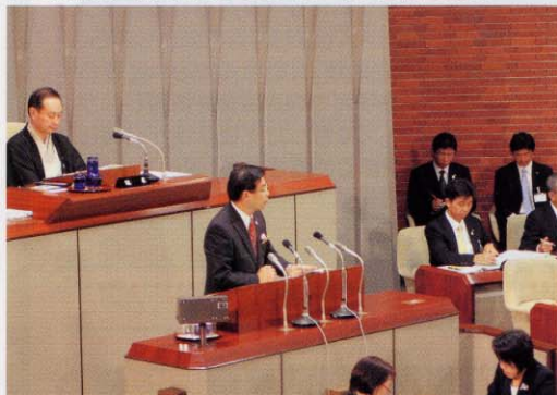
議案説明する山田啓二知事